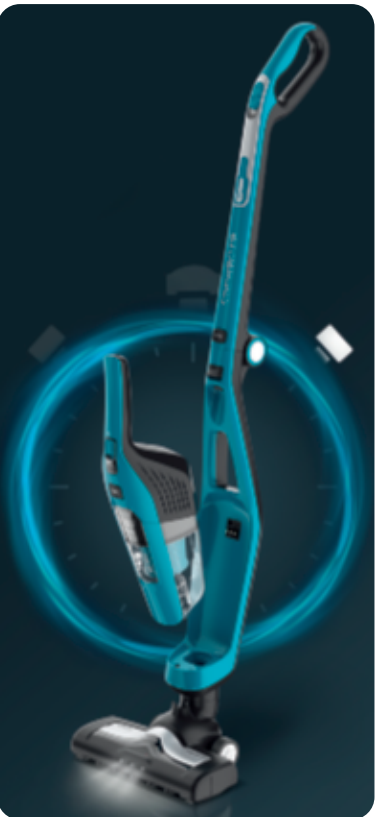
DUAL FORCE™ 2 in 1

FR Guide de l'utilisateur / EN User's guide / DE Bedienungsanleitung / NL Gebruiksaanwijzing / ES Guía del usuario / PT Guia de utilização / IT Manuale d'uso / EL Οδηγός χρήσης / TR Kullanım kılavuzu / CS Návod k použití / SK Používateľská príručka / HU Használati útmutató / PL Instrukcja obsługi / ET Kasutusjuhend / LT Naudotojo vadovas / LV Lietošanas pamācība BG Ръководство на потребителя / RO Ghidul utilizatorului / SL Navodila za uporabnika / HR Upute za uporabu / BS Upute za upotrebu / SR Uputstvo za upotrebu / RU Руководство пользователя / UK Посібник користувача / CN 用户指南 / HK 用戶指南 / JP 取扱説明書 / KO 사용자 가이드 / AR دليل المستخدم / FA راهنمای کاربر